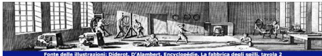
Fonte delle illustrazioni: Diderot, D'Alambert, Encyclopédie, La fabbrica degli spilli, tavola 2

Fonte: Smith A., (1776), Ricerca sopra la natura e le cause delle ricchezze delle nazioni